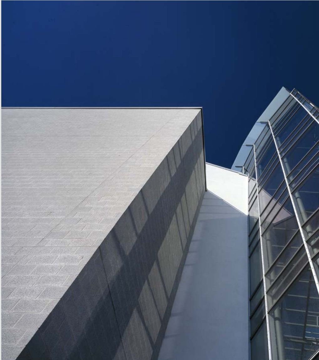
+ Medienzentrum Düsseldorf 241

Kategorie: Sonderbauten Bauherr: Gebau AG, Lindner Gruppe Leistungen: LP 1-5 Teilleistungen: LP 6-9