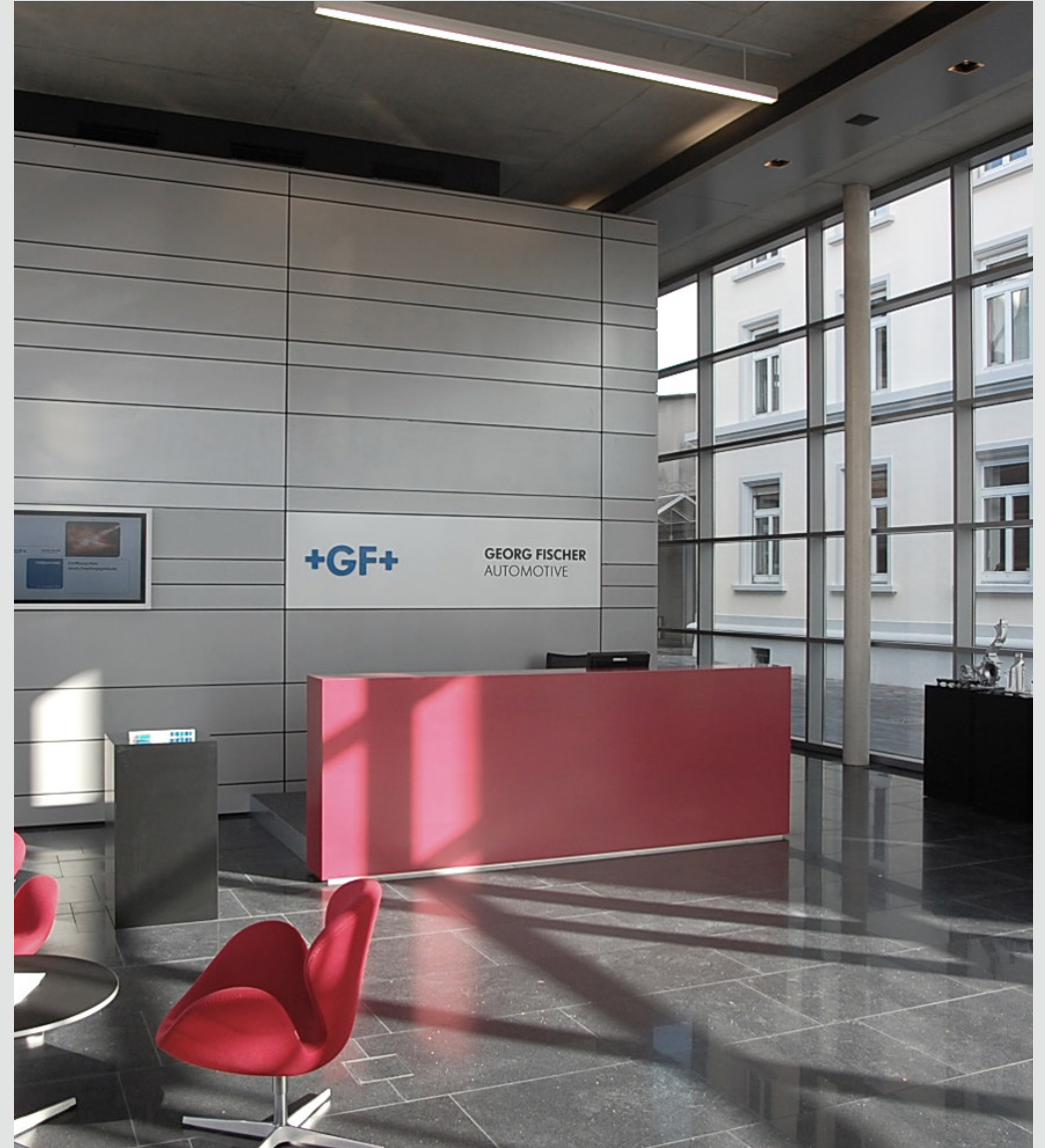
+ Georg Fischer Eingangshalle Singen 298

Kategorie: Sonderbauten Bauherr: Georg Fischer GmbH & Co. KG Leistungen: LP 1-9