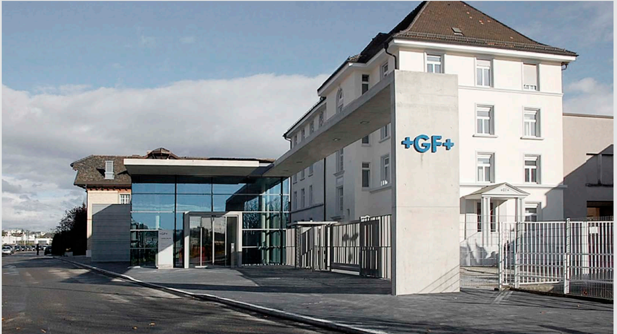
+ Georg Fischer Eingangshalle Singen 298

Kategorie: Sonderbauten Bauherr: Georg Fischer GmbH & Co. KG Leistungen: LP 1-9