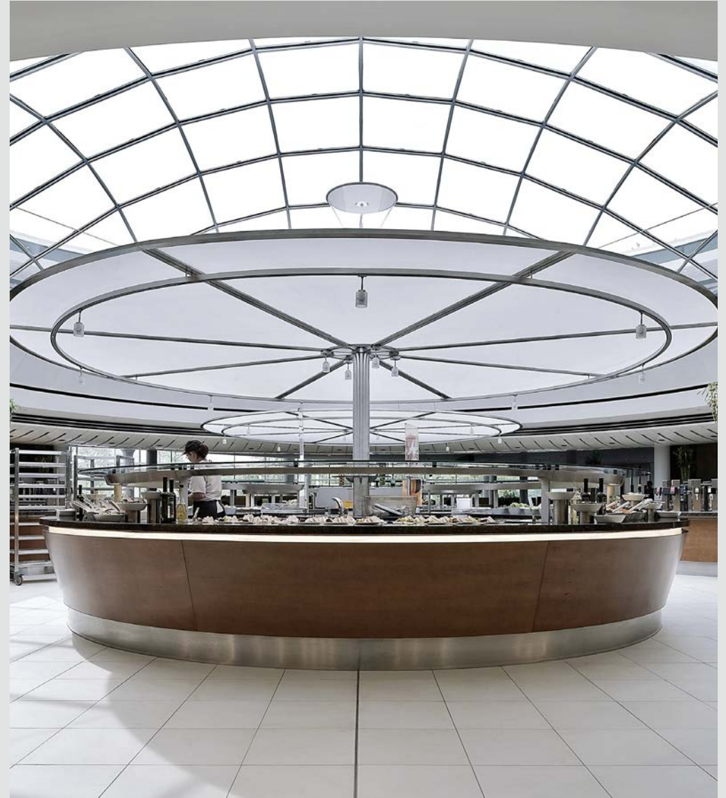
+ Mitarbeiterrestaurant & Gästecasino Standort: Ingelheim 276

Kategorie: Sonderbauten Bauherr: Boehringer Ingelheim Pharma GmbH & Co. KG Leistungen: LP 1-9