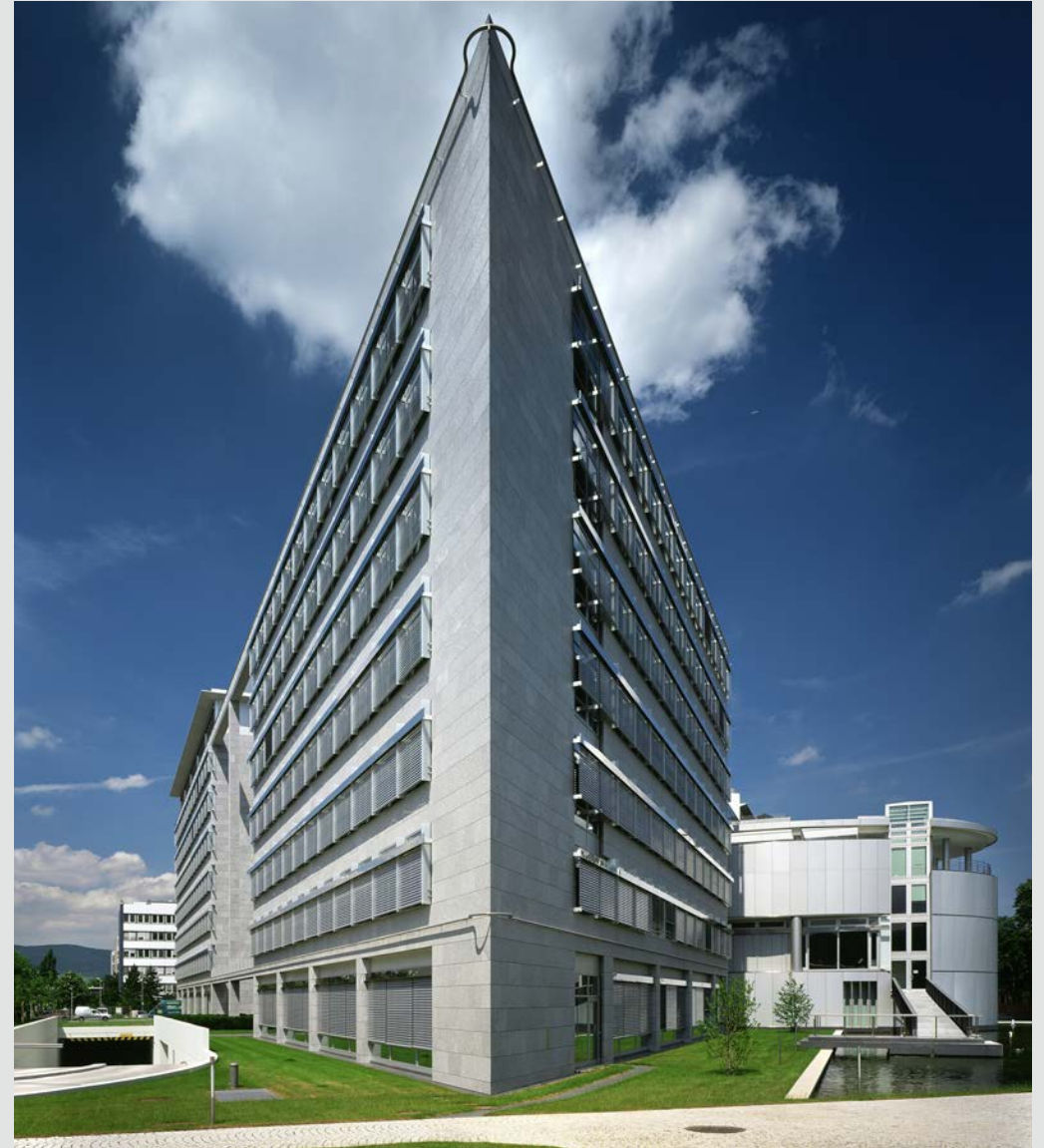
+ Boehringer Ingelheim Center Standort: Ingelheim 257

Kategorie: Verwaltungsbauten Bauherr: Boehringer Ingelheim Pharma GmbH & Co. KG Leistungen: LP 1-5, Teileleistungen: LP 6-9