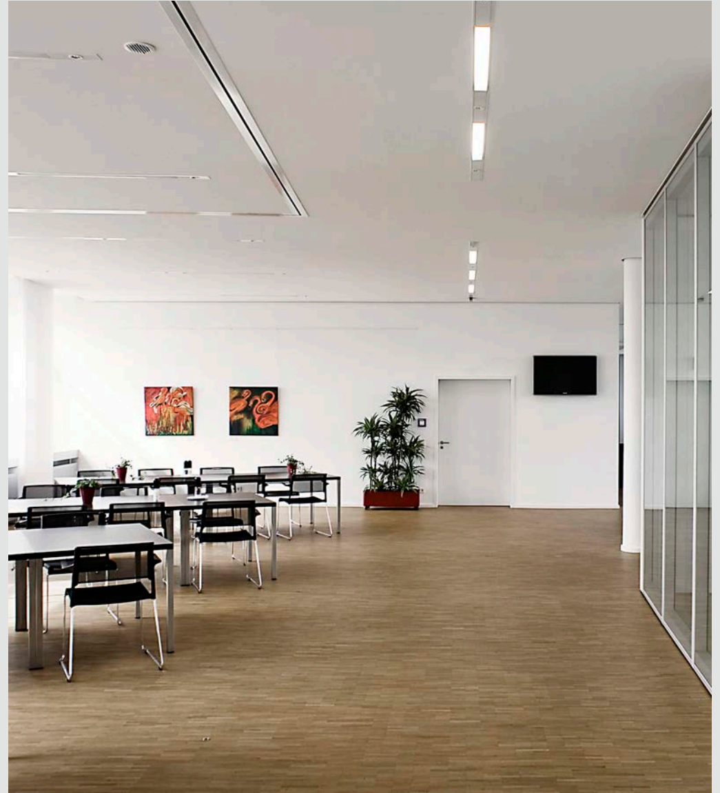
+ Wupperverband Betriebsrestaurant Kategorie: Sonderbauten Wuppertal Bauherr: Wupperverband 296 Leistungen: LP 1-9